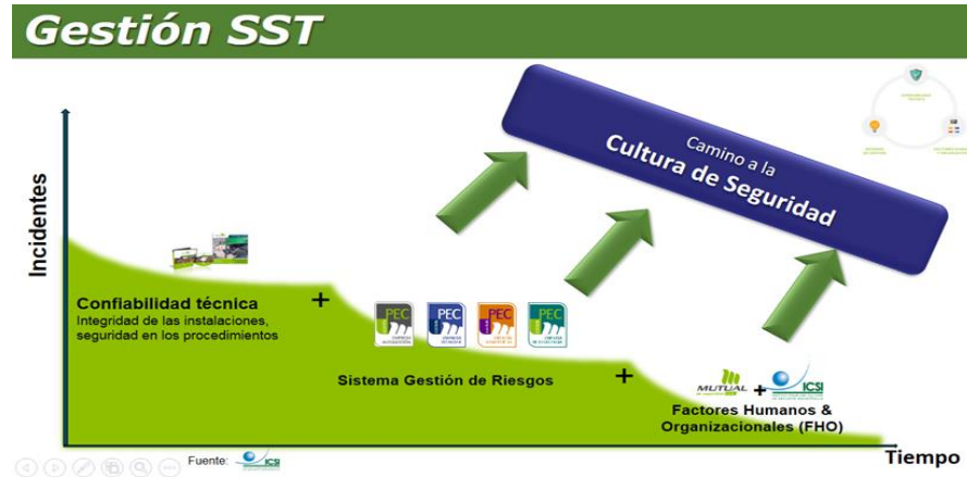
Fig. 2. Estrategia de Cultura de Seguridad, ICSI.

Finalmente, la estrategia de Cultura de Seguridad conduce al abordaje de los Factores Humanos y Organizacionales , que se traducen en la gestión de los riesgos a partir de un análisis del contexto organizacional y no centrado en el trabajador. (Fig.2)