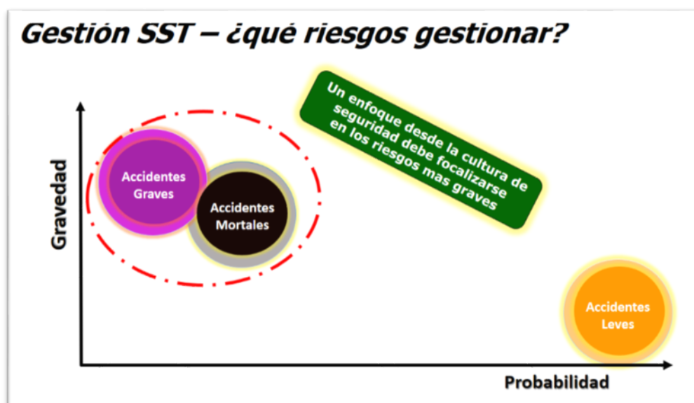
Fig. 1 Enfoque de la Gestión de Riesgos con foco en Gravedad.

Para el año 2021 el foco de asesoría se realizará en las empresas identificadas como críticas que corresponden a 2990 empresas, en las que se espera la reducción de las tasas de mortalidad y gravedad y por ende, un impacto en la reducción de los accidentes de trabajo.