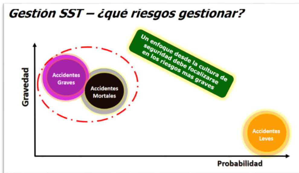
Fig. 1 Enfoque de la Gestión de Riesgos con foco en Gravedad.

Para el año 2020 el foco de asesoría se realizará en las empresas identificadas como críticas que corresponden a 3100 empresas, en las que se espera la reducción de las tasas de mortalidad y gravedad, y por ende, un impacto en la reducción de los accidentes de trabajo.