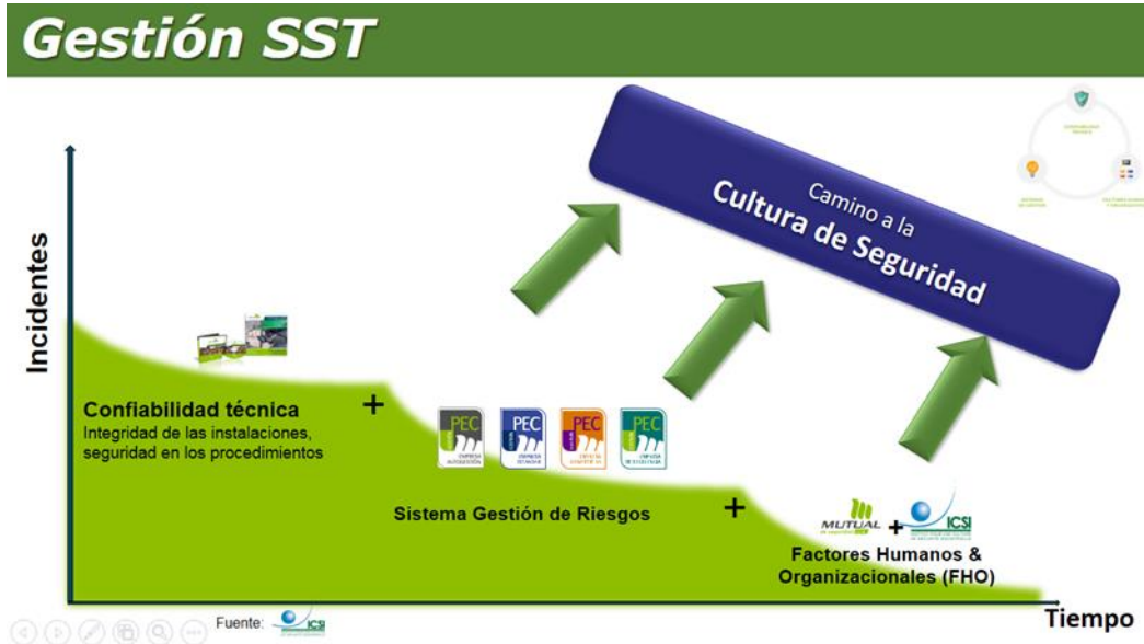
Fig. 2. Estrategia de Cultura de Seguridad, ICSI.