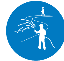
HUMECTAR VÍAS DE CIRCULACIÓN